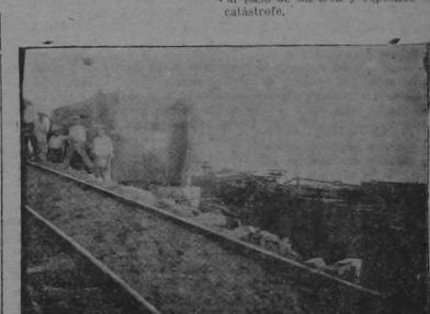
Vista de la posición en que quedaron dos de los carros que descarrilaron el sábado en la Roca de Carballo. Fotografía tomada anterior.

Por peritos ferroviarios, está constatada la circunstancia que motivó la catástrofe ferroviaria en la Roca de Carballo el sábado último y que es la misma señalada por nosotros en la crónica que del suceso hicimos en la edición anterior: esto es, que en todo el tramo de la vía férrea que hay entre el agua salada ha crecido los rieles, debilitándolos en resistencia; así, pues, aquellos rieles que debían pesar 50 libras por varilla, no pesan más que la mitad, esto es, 25 libras; en consecuencia, el desastre es terrible.